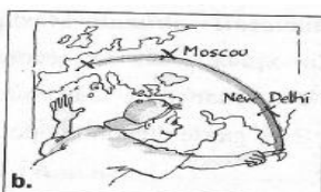
(faire le tour du monde) Je _____