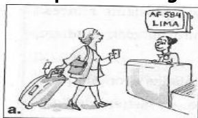
(voyager) Je vais voyager .