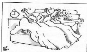
(se lever) Ils _____