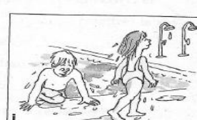
(se doucher) Ils _____